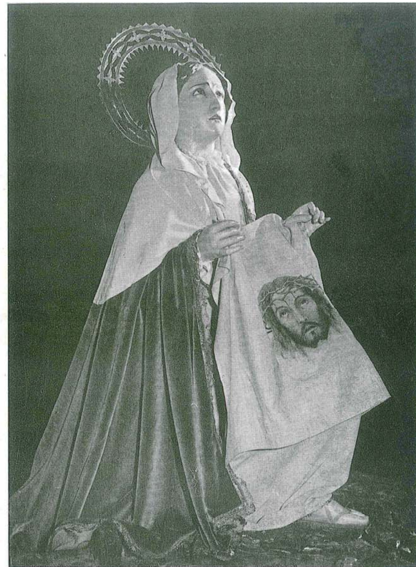
«La Feronica» detalle del paso «Jesús Nazareno»

Dep. Leg. T. 272 - 1963 - Suc. de Torres y Virgili