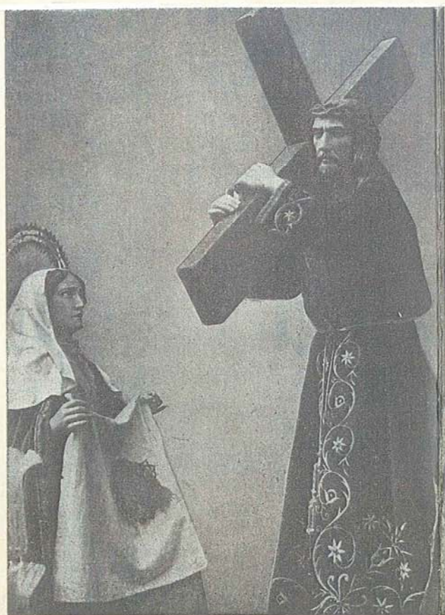
Detalle del Paso «La Verónica»