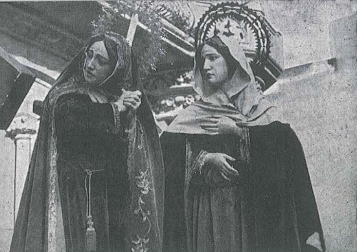
Detalle del Paso «La Verónica»