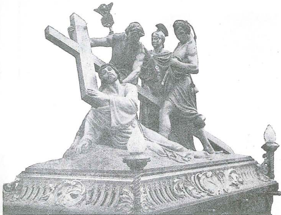
«Primera Caída de Jesús»

A l hallarnos de nuevo ante las solemnidades de SEMANA SANTA, la Junta Directiva de la REAL HERMANDAD DE JESUS NAZARENO, cumple con un deber ya tradicional al ofrecer a todos sus asociados y bienhechores, este modesto programa de los actos en que tomarán parte todos los Hermanos Nazarenos, poniendo como siempre de manifiesto el constante estímulo de mantener vivo el hacer de la Cofradía y demostrar una vez más el amor de nuestra Fe y a las tradiciones siguiendo las huellas del Divino Nazareno camino del Calvario